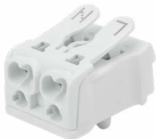
2-ПОЛЮСНАЯ С МОНТАЖНЫМИ НОЖКАМИ

Предназначена для присоединения и ответвления одножильных и многожильных медных проводников в электрических цепях переменного тока напряжением до 450 В.