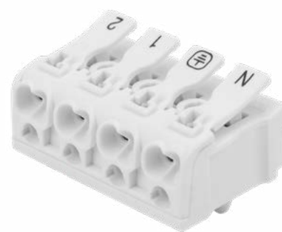
4-ПОЛЮСНАЯ С МОНТАЖНЫМИ НОЖКАМИ