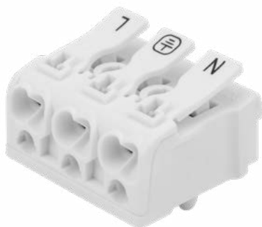
3-ПОЛЮСНАЯ С МОНТАЖНЫМИ НОЖКАМИ