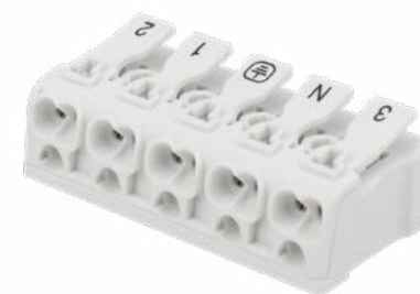
5-ПОЛЮСНАЯ С МОНТАЖНЫМИ НОЖКАМИ