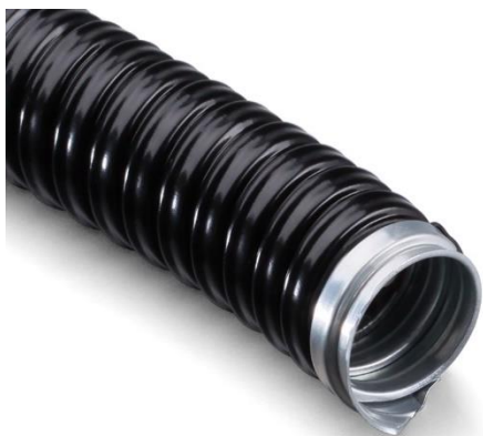
Металлорукав в ПВХ оболочке