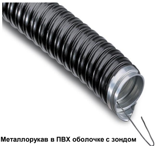
Металлорукав в ПВХ оболочке с зондом