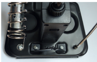
Сначала открутите 2 винта

Обратите внимание, что 2 железные палочки используются для удержания катушки с паяльной проволокой. Перед использованием открутите 2 винта, установите 2 железные палочки в вертикальное положение, закрепите и затяните винты назад.