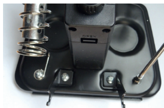
2 железные палочки используются для удержания