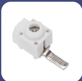
Арт. 11-2251 прямой ввод