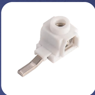
Арт. 11-2254 ввод сбоку