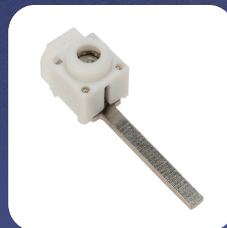
Арт. 11-2258 удлиненная, прямой ввод

Номинальное поперечное сечение: 4-25 мм 2