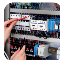
Сборка щитового оборудования